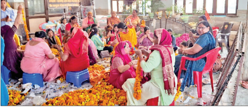
झज्जर। बाबा प्रसाद गिरी मंदिर में फूलों की माला बनाते हुए महिला श्रद्धालु।

नगर खेड़ा बाबा प्रसाद गिरी महाराज मंदिर के 53वें वार्षिकोत्सव का बुधवार से आगाज होगा। इसके लिए पूरी तैयारियां कर ली गई हैं। मंदिर परिसर को फूलों से सजाया गया है। दिनभर श्रद्धालु मंदिर परिसर में तैयारियों को अंतिम रूप देने में जुटे रहे। महिला श्रद्धालुओं ने फूल मालाएं पिरोईं, वहीं अन्य श्रद्धालुओं ने मेले के दौरान की