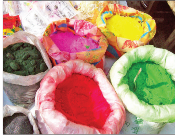
बहादुरगढ़। शहर के बाजार में उपलब्ध रंग।

दरअसल, केमिकल युक्त रंग-गुलाल बनाने के लिए कुछ निर्माता डीजल, इंजन आयल, कॉपर सल्फेट, मेलाकाइड ग्रीन