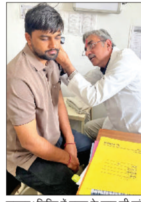
झज्जर। शिविर में युवक के कान की जांच करते हुए विशेषज्ञ।