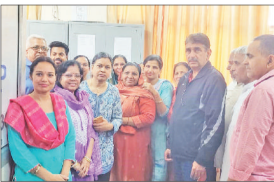
बहादुरगढ़। प्राधिकरण कार्यालय पहुंचे सेक्टर-2 के प्रभावित लोग।

अब सुबह साढ़े 7 से साढ़े 9 बजे तक देंगे पानी सेक्टर में अधिकारियों के दौरे के बाद रेजिडेंट्स की बैठक भी हुई। इसमें क्षेत्रवासियों ने अधिकारियों के समक्ष समस्या विस्तार से रखी। बैठक में सहमति बनी कि सेक्टर-2 में प्रतिदिन सुबह साढ़े सात से साढ़े 9 बजे तक दो घंटे नियमित रूप से पर्याप्त प्रेशर के साथ पानी की आपूर्ति की जाएगी। साथ ही 1400 नंबर लाइन में के.आर मंगलम स्कूल के पीछे वाले क्षेत्र को पांच मार्च की शाम तक संबंधित लाइन से जोड़ने का आश्वासन दिया गया।