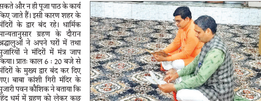
झज्जर। बाबा काशी गिरी मंदिर में धार्मिक पुस्तक पढ़कर सर्व मंगल की कामना करते हुए ब्राह्मण।