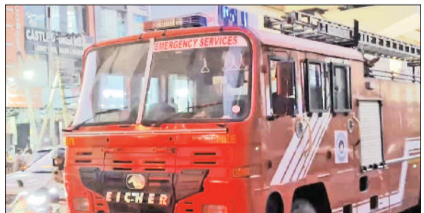
बहादुरगढ़। मौके पर आग बुझाने पहुंची दमकल गाड़ी।

दिल्ली-रोहतक रोड पर स्थित श्रीबालाजी होंडा शोरूम में हादसा, फायर ब्रिगेड की तीन गाड़ियां बचाव कार्य में लगी