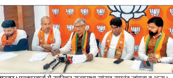
झज्जर। पत्रकारवार्ता में उपस्थित राज्यसभा सांसद रामचंद्र जांगड़ा व अन्य।

मंगलवार को भाजपा के कमलम कार्यालय में प्रदेश बजट को लेकर एक पत्रकार वार्ता का आयोजन किया गया। इस दौरान राज्यसभा सांसद रामचंद्र जांगड़ा ने बजट के विभिन्न प्रावधानों पर विस्तार से प्रकाश डाला और इसे प्रदेश के सर्वांगीण विकास की दिशा में ऐतिहासिक बताया। उन्होंने बताया कि कृषि संबंधी गतिविधियों में वर्ष 2014-15 में 1656.86 करोड़ से बढ़ाकर 2026-27 में 8319.77 करोड़ रुपये का प्रावधान किसानों