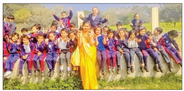
बहादुरगढ़। शिक्षिका संग खुशी का झंझार करते विद्यार्थी।

विभाग द्वारा जारी किए जाएंगे। साथ ही पार्किंग, सुरक्षा, पीने के पानी, रात्रि के समय रोशनी के इंतजाम, स्वास्थ्य सुविधाएं, अस्थाई शौचालय, सीसीटीवी, माइक सर्विस व अग्निशमन सेवाएं आदि इंतजामों की व्यवस्था को लेकर संबंधित अधिकारियों को निर्देश दिए। उन्होंने बताया कि श्रद्धालुओं की उमड़ने वाली भीड़ को लेकर कानून व्यवस्था बनाए रखने के लिए ड्यूटी मजिस्ट्रेट भी नियुक्त किए जाएंगे। मेले के दौरान लगने वाले भंडारों में सिंगल यूज प्लास्टिक पर पूरी तरह पाबंदी रहेगी। उन्होंने स्वास्थ्य विभाग के अधिकारियों को मंदिर परिसर में नवरात्र से ही मेडिकल यूनिट स्थापित करने के निर्देश दिए।